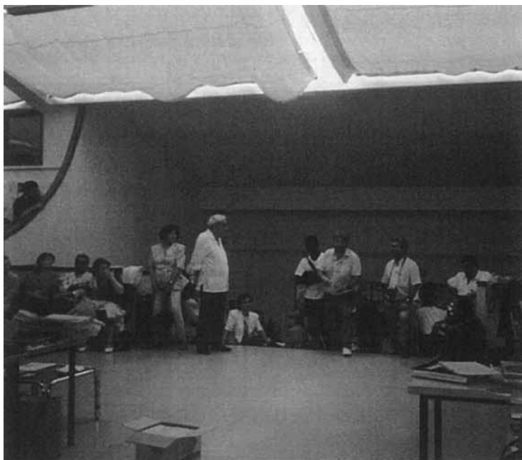
VI Trobada estatal d'Escoles Associades a O Grove (Galícia, 1993).