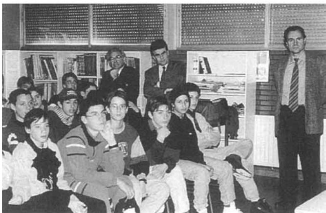
Alumnes de l'escola de Ciudad Segundo Montes (El Salvador).