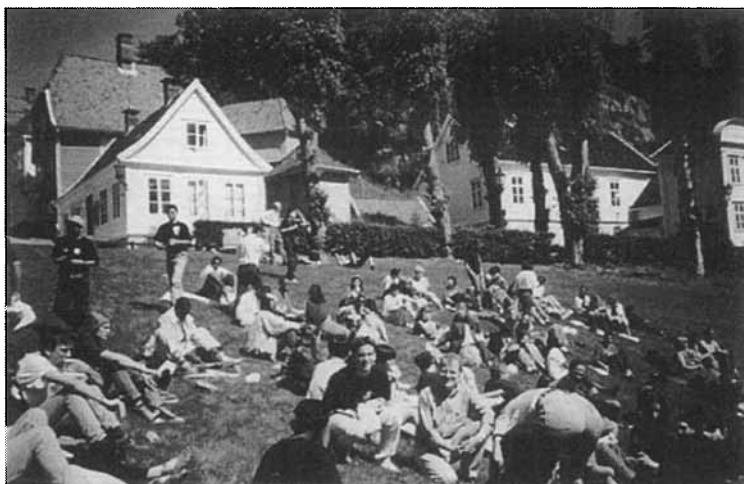
Fòrum de joves sobre el Patrimoni Mundial (Bergen, 1995).